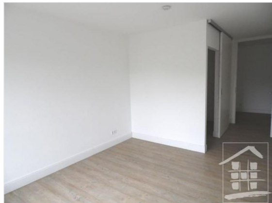
Schlafzimmer mit Ankleide