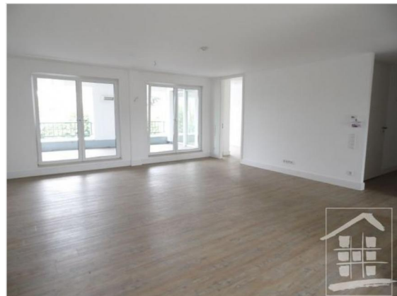
Wohnzimmer mit Zugang zur Loggia