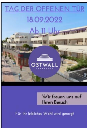
Tag der offenen Tür