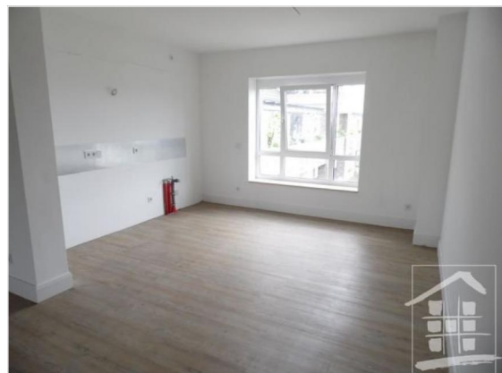
Wohnzimmer mit Blick zur Küche