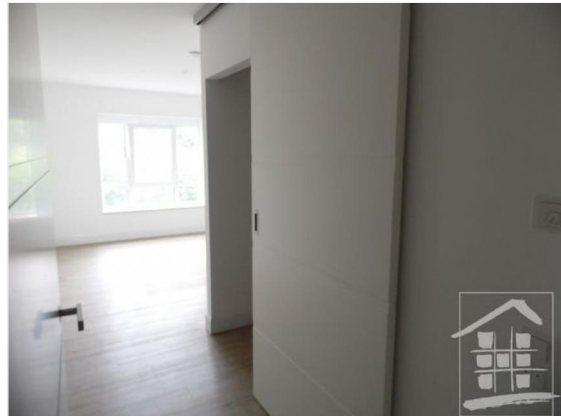
Schlafzimmer mit Ankleide